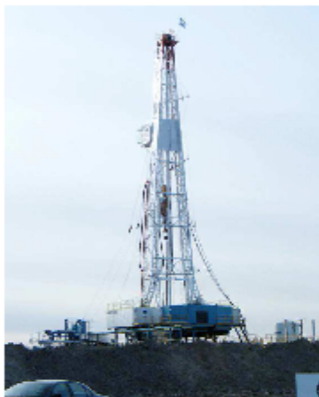
Tour de forage à Saint-Denis-sur-Richelieu

Quel prix sommes-nous prêts à payer pour laisser l'industrie gazière s'installer sur notre territoire?